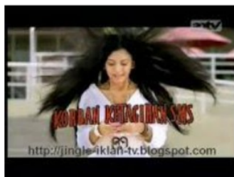
Gambar 4: Iklan Korban Ketagihan SMS XL

Bahasa iklan yang digunakan merupakan bahasa sehari-hari dalam percakapan tindak tutur nonbaku atau ragam gaul dalam percakapan antar penutur