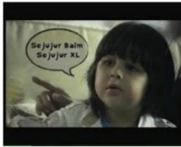
Gambar 2. Iklan XL Versi Baim

Bahasa iklan di atas kalau tidak diterjemahkan tentu biasa-biasa saja. Namun persaingan antara XL dan Kartu AS termasuk kedalam persaingan merk, dimana di dalamnya terjadi persaingan dalam penetapan harga, feature yang ditawarkan dan yang paling kentara adalah pada persaingan iklan. Berkali-kali dapat dilihat pada iklan-iklan kartu XL dan kartu AS saling menjatuhkan dengan cara saling memurahkan tarif sendiri.