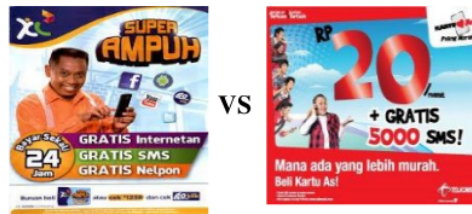
Gambar 2: Foto Iklan XL dengan Iklan Kartu AS

Perseteruan operator seluler paling seru adalah antara XL dan Telkomsel. Berkali-kali kita dapat melihat iklan-iklan kartu XL (PT Excelcomindo Pratama) dan kartu AS (PT. Telekomunikasi Seluler) saling menjatuhkan dengan cara saling memurahkan tarif sendiri. Persaingan kartu yang sudah ternama ini kian meruncing dan langsung tak tanggung-tanggung menyindir satu sama lain secara vulgar. Kedua operator ini secara bersamaan menggunakan Jargon “Telefon Murah.” Ada banyak cara yang dilakukan untuk menarik menarik simpati pemirsa, sehingga dengan bahasa iklan yang sedemikian rupa diharapkan mampu memberikan daya pikat tersendiri. Diantara daya tarik tersebut diantaranya: