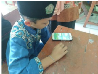
Gambar 1.4. Kegiatan Evaluasi

Setelah siswa mendapatkan penjelasan dari peneliti tentang penggunaan aplikasi bangun datar, siswa diminta untuk mengoperasikan sendiri dan peneliti memberikan soal sebagai evaluasi kepada siswa. Kegiatan evaluasi ditunjukkan pada Gambar 1.4.