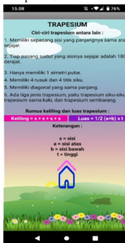
Gambar 1.2. Bangun Trapesium

Dari tampilan diatas, siswa dapat memilih salah satu bangun datar yang ingin dipelajari dengan cara klik gambar yang dituju. Misalkan siswa ingin lebih tahu tentang trapesium, maka siswa dapat meng-klik gambar bangun trapesium dan akan muncul tampilan bangun trapezium yang ditunjukkan pada Gambar 1.2.